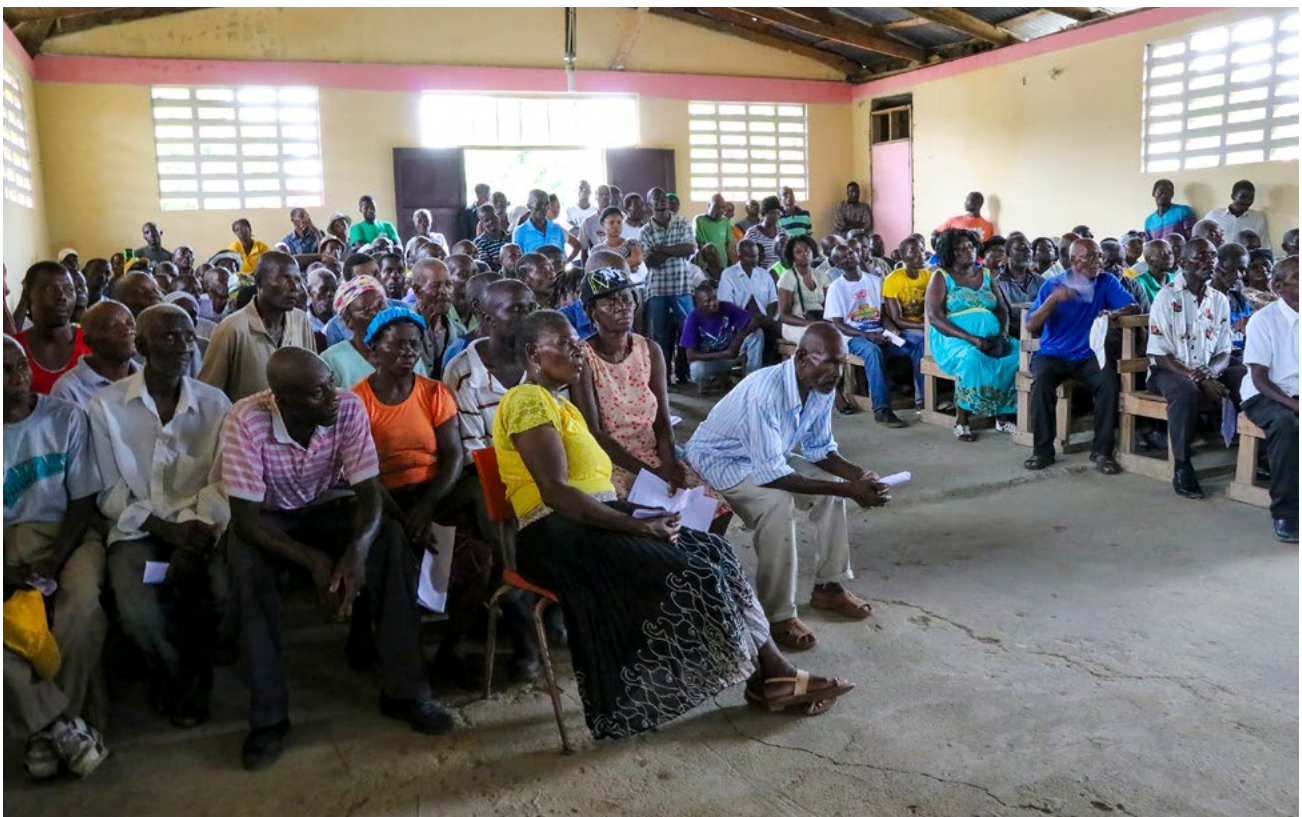
Kolektif la rakontre pou tande mizajou e bay komantè pandan pwosès negosyasyon nan.

Nan dat 12 Janvye 2017, Kolektif la, avèk sipò AREDE, ActionAid ak Accountability Counsel, te depoze yon plent detaye devan Mekanis Endepandan pou Konsiltasyon ak Envestigasyon (MICI) ki anndan IDB pou mande kont ak reparasyon pou domaj yo te viktim akòz deplasman yo (Kolektif 2017). Plent lan te detaye tout preyokipasyon ki genyen konsènan enpak anviwònman ak sosyal fonksyonman CIP la, tankou polisyon sous dlo ki vital pou yo ak presyon ki ap egzèse sou resous lokal yo akòz kantite travayè ki vini nan zòn nan. Soti Mas pou rive Jen 2017, MICI te vizite Ayiti (Pòtoprens ak Karakòl) epi yo te rankontre avèk Kolektif la, IDB epi gouvènman Ayisyen an plizyè fwa pou evalye elijibilite plent lan epi gade si li posib pou genyen yon pwosesis dyalòg. An Jen 2017, aprè IDB fin ekprime volonte pou patispe nan yon dyalòg avèk Kolektif la (gouvènman Ayisyen an te plis ezitan nan kòmansman), MICI te detèmine pwosesis dyalòg la dwe kòmanse (MICI p.g.d). An Oktòb 2017, premye sou sis rankont ki te prevwa pandan dyalòg la te reyalize an Ayiti (yo chak te dire de jou) avèk reprezantan IDB, gouvènman ayisyen an, Kolektif la ak konseye yo. Gen avanse ki te rive fèt ant plizyè reyinyon fòmèl yo sou 19 aksyon pwovizwa yo te jwenn akò sou yo (MICI 2019). Pwosesis dyalòg sa te finalman debouche sou yon akò pati yo te jwenn an Desanm 2018.