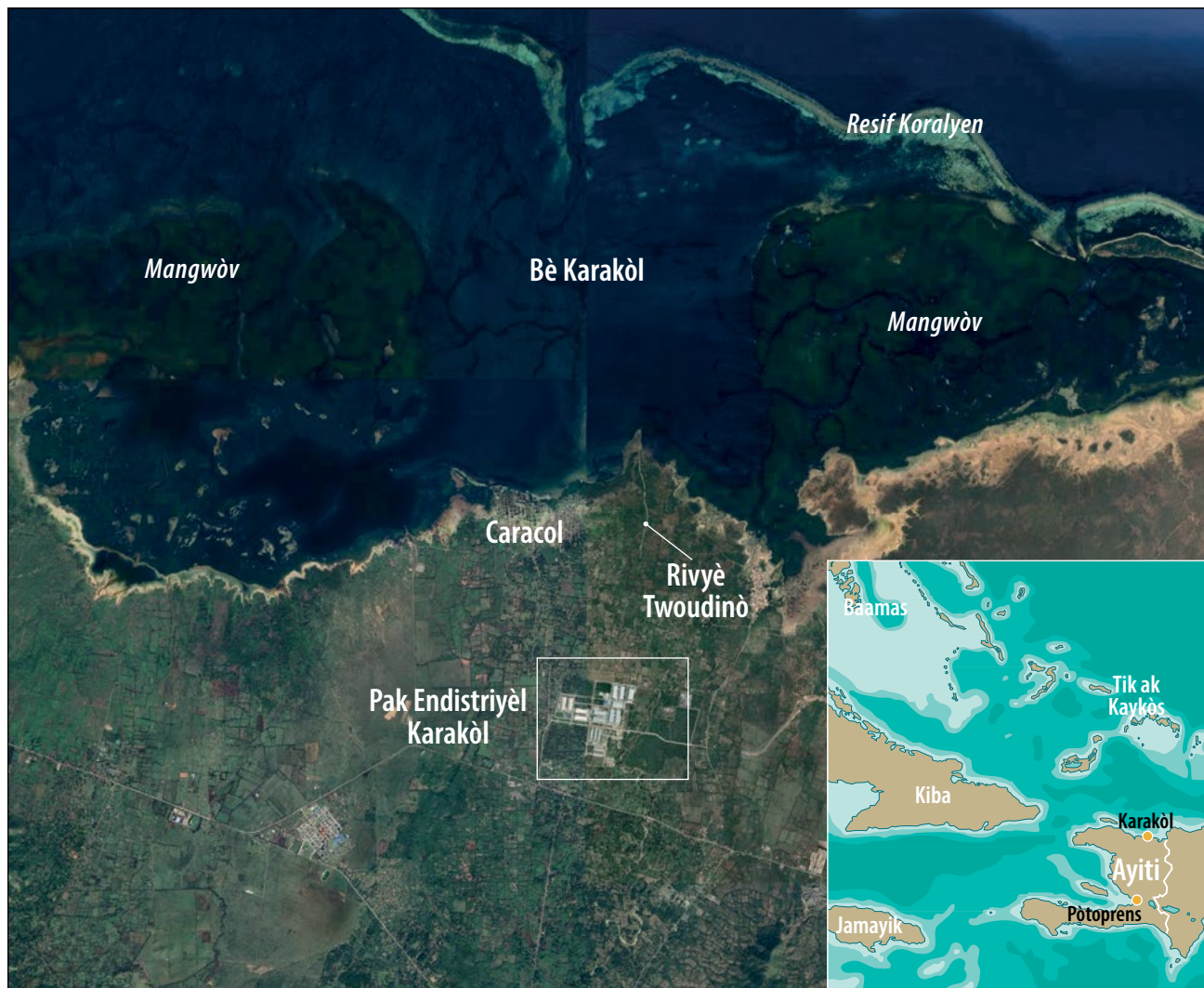
Figi 1. Pak Endistriyèl Karakòl an Ayiti ak rejyon ki antoure yo

CIP la fè pati yon zòn franch ki etabli sou yon sipèfisi 250 ekta tè ki prensipalman akeyi faktori ki ap pwodui rad. Ladan li genyen plizyè batiman administratif, enfrastrikti pou estokaj ak tretman dechè solid ak likid, yon santral ki pwodui 10 megawat kouran ak lòt enfrastrikti ki asosye avèk yo. Li twouve li nan depatman Nòdès Ayiti, epi li twouve li a yon distans anviwon 4 kilomèt Bè Karakòl—ki genyen yon ekosistèm kotyè sansib ki genyen mangwòn, zèb maren, bè a ak resif koralyen ki soti Okap pou rive an Repiblik Dominiken. 3 Nan kòmansman lane 2011, CIP la te konstwi epi se Inite Teknik Egzekisyon (ITE) ki soti anndan Ministè Ekonomi ak Finans peyi Dayiti ki te kòmanse jere li. An Me 2014, yo te transfere responsabiltè jesyon an bay Sosyete Nasyonal Pak Endistriyèl (SONAPI) men li tounen nan men ITE ankò an 2019 akòz move rezilta SONAPI (konsilte Le Nouvelliste 2019; IDB p.g.d, a).